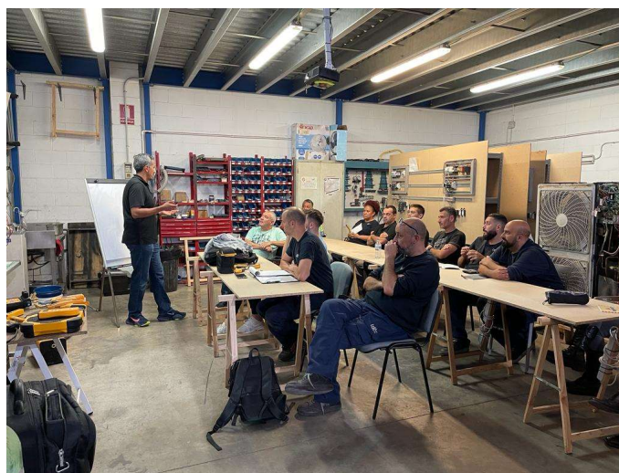
Produkt-Training beim Kunden