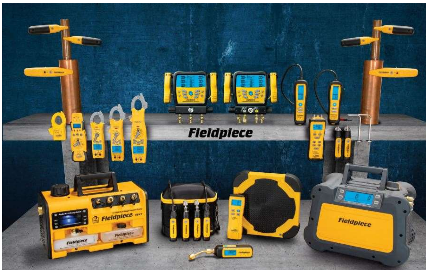
Kälte-, Klima- und Wärmepumpen – Werkzeuge (Absaugstation, Vakuumpumpe, digitale Monteurhilfe, usw.)