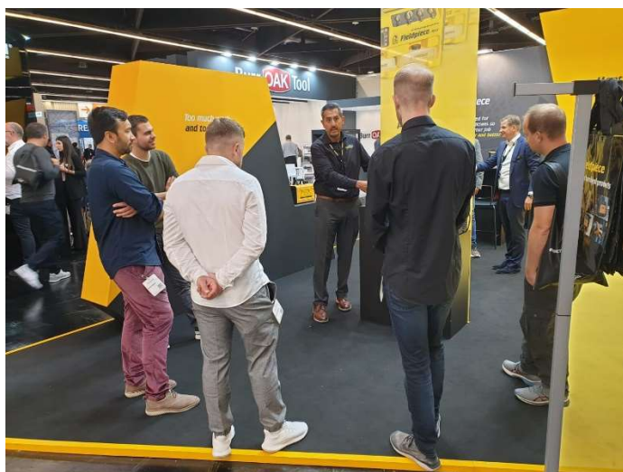
Chillventa 2022 (Messestand Fieldpiece)